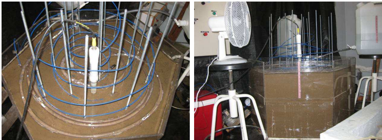
Figura 1. Columna de suelo: (a) vista del extremo superior de la columna y (b) vista frontal.

El procedimiento experimental para estudiar la infiltración consistió, primero, en verter la cantidad de agua para alcanzar una altura de agua media sobre la superficie del suelo, aproximada, de 1,5 cm, para lo que se empleó cinco minutos. Para ello, se contó con tres bidones de 35 L de capacidad con llave de desagüe en su extremo final a la que se conectó una tubería perforada con orificios circulares del mismo diámetro y separados una misma distancia. La tubería se colocó formando círculos sobre la superficie del suelo (ver Fig.1). Seguidamente, desde dos de los bidones, se vertió agua de forma continua durante 140 min aportándose un total de 441 L. La lámina de agua se distribuyó de forma variable, debido a las irregularidades de la superficie del suelo, oscilando entre 2 a 2,7 cm en el centro y parte derecha de la columna y de 1 a 1,7 cm en el resto.