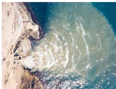
Figura 2. Pluma de contaminación de una DSS

Estas obligaciones se resumen a continuación: