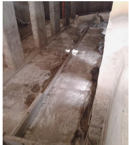
Figura 4. Ejemplo de tanque de tormenta