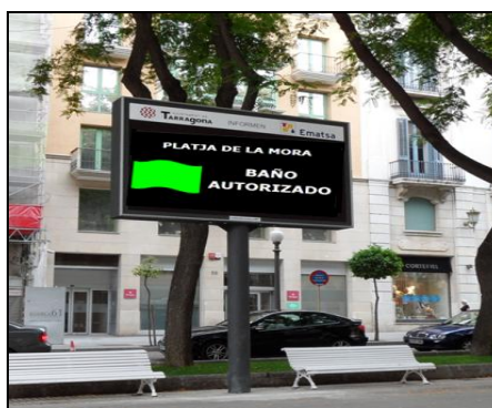
Figura 6. Ejemplo de panel informativo de DSS en playas.