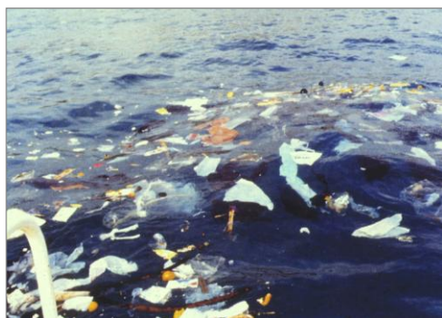
Figura 1. Impacto de los flotantes debido a una DSS

Así el nuevo texto, ya permite los desbordamientos de los sistemas de saneamiento en episodios de lluvia, admitiendo que en la práctica no es posible construir sistemas colectores y las instalaciones de tratamiento de manera que se puedan someter a tratamiento la totalidad de las aguas residuales en episodios de lluvia. Pero también admite que estos desbordamientos no pueden producirse en cualquier circunstancia, de manera que se incorporan obligaciones con el objetivo de limitar la contaminación producida por estos desbordamientos.